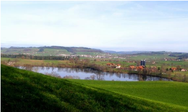
Soppensee vom Galgebergwald