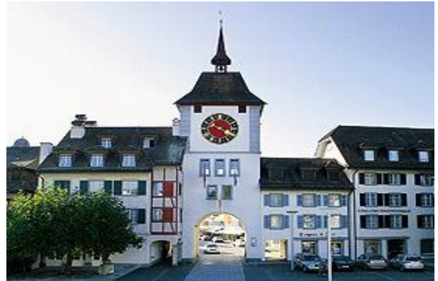
Willisau, Tor zur Altstadt